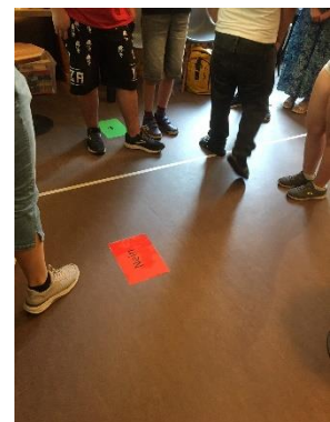
Eine Klasse positioniert sich.

Die Projekttag folgten grundsätzlich einem einheitlichen Muster: Der erste Teil der Veranstaltung war dem Einstieg ins Thema gewidmet. Anhand eines Positionierungsspiels zu den Themen „Mitbestimmung bei einem Klassenausflug“ und „Fairness beim Fußballspiel“ entwickelte die Klasse eine (Arbeits-) Definition des Begriffs „Demokratie“. Im Fokus standen dabei die demokratischen Werte Mitbestimmung, Meinungsfreiheit und Gleichheit bzw. Gleichberechtigung.