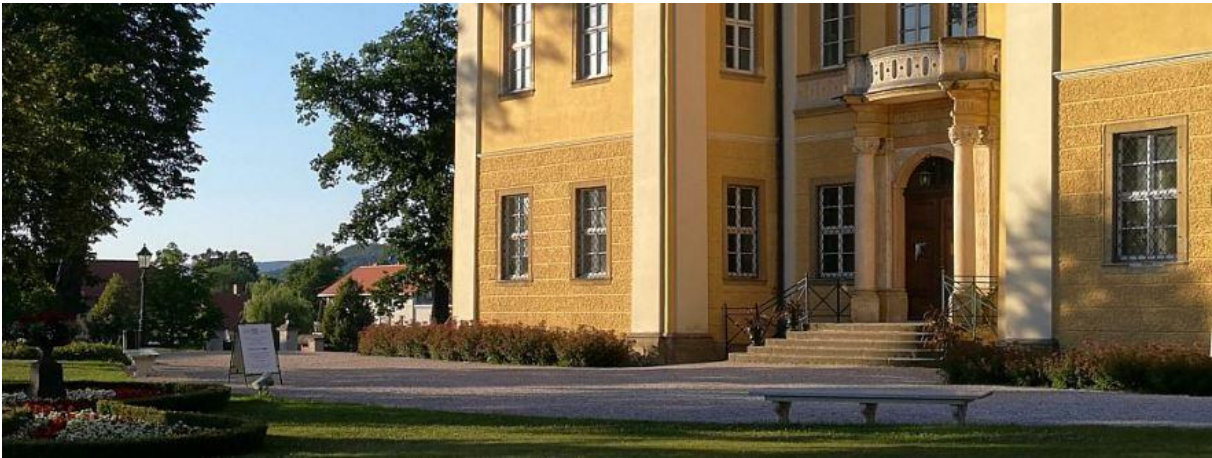
Schloss Lomnitz, Foto: Arne Franke